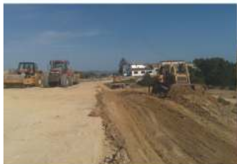
Moviments de terra