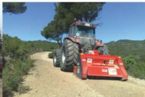
Rectificació de camins