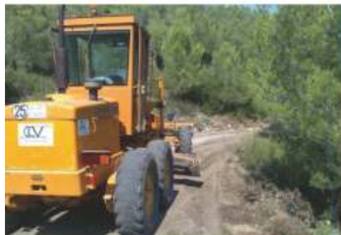
Arranjament pistes forestals